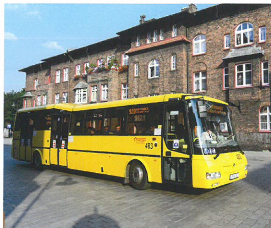
Związek metropolitalny wykonuje zadania publiczne w zakresie publicznego transportu zbiorowego na obszarze związku

Zgodnie z przepisem art. 15a Ustawy o publicznym transporcie zbiorowym : związek metropolitalny obowiązkowo ustanawia zintegrowany system taryfowo-biletowy obowiązujący w jego granicach. Organizatorzy gminnych i powiatowych przewozów pasażerskich na terenie związku metropolitalnego są obowiązani do uczestnictwa w systemie taryfowo-biletowym. Wzajemne rozliczenia z tytułu uczestnictwa organizatorów gminnych i powiatowych przewozów pasażerskich